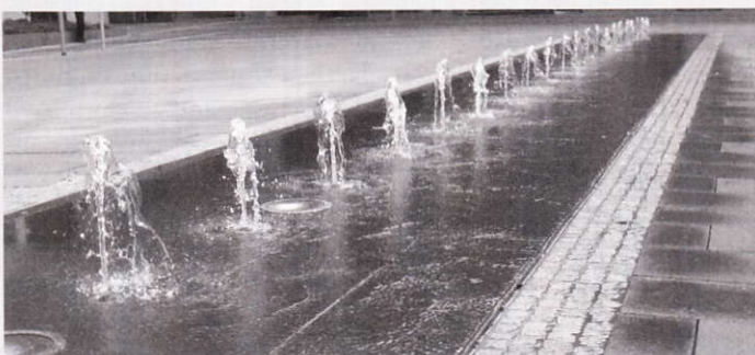
Schlitzrinne BIRCOtop Serie S entwässert die Brunnenanlage im Eschborn Plaza

Kontakt: www.mall.info , www.BIRCO.de , www.braunsteine.de