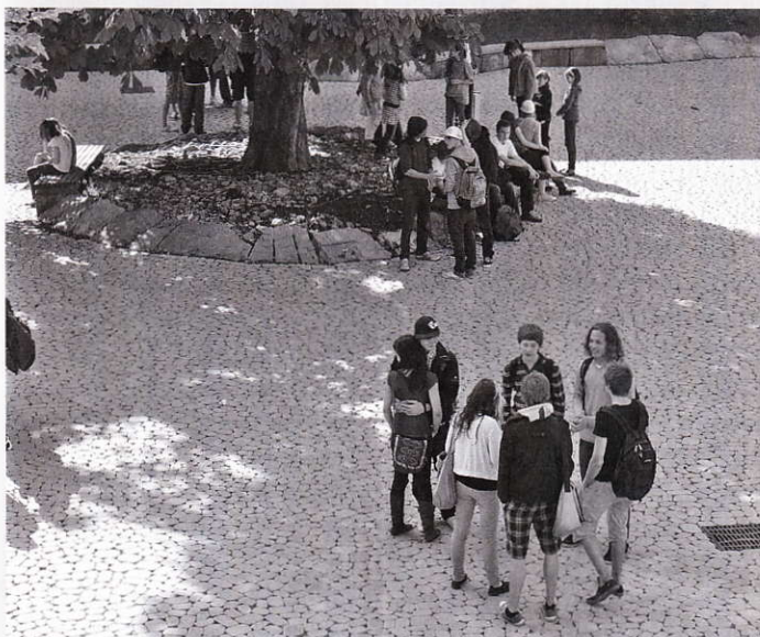
Pflasterfläche versickerungsaktiv in einem Schulhof, bei Bedarf als Parkplatz nutzbar

Pflastersysteme, die über aufgeweitete Fugen oder über die Steine selbst eine weitgehende Versickerung der Niederschläge gewähren, bieten Möglichkeiten, einer Versiegelung ent-