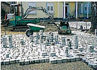
Pflastersteine mit etwa 5 mm Fuge verlegen. Mit Richtschnur oder Richtlatte Steinhöhen und Reihenverläufe überprüfen und beim Verlegen Kreuzfugen vermeiden.