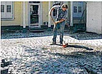
In die Fugen der frisch verlegten Fläche Sand oder Splitt (Material des Pflasterbettes) kehren und mit Wasser einschwemmen. Anschließend den trockenen Belag bis zur Standfestigkeit abrütteln.