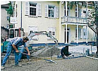
Nach dem Auskoffern der Fläche, Einbringen und Verdichten einer frostsicheren, 15 bis 30 cm starken Tragschicht aus Schotter oder Grobkies, das Pflasterbett vorbereiten.