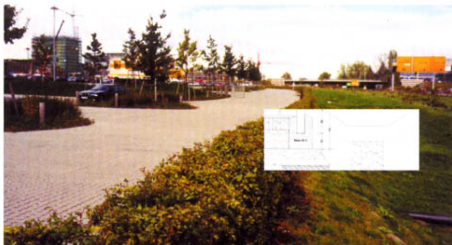
Versickerungsfähig ausgebildete Verkehrsfläche mit angeschlossener Entwässerungsanlage.

Eine ordnungsgemäße Entwässerung von Verkehrsflächen kann nur durch das vollständige Abführen der gesamten Oberflächenabflüsse erreicht werden. Hierbei lässt sich nach dem FGSV-Merkblatt für wasserdurchlässige Befestigungen als maßgebliches zu versickerndes Regenereignis ein Wert von pauschal 270 l/(s ha) angeben. Er sollte aber aufgrund von Auswertungen örtlicher Regenrei-