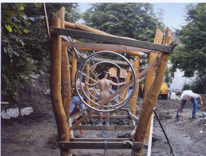
Blick auf die große Fischreuse, die den Kindern viele Möglichkeiten zum Kriechen und Klettern bietet.

tionalitäten zwischen 18 und 30 Jahren. Umgekehrt werden Deutsche innerhalb eines internationalen Netzwerks an Projekte im Ausland vermittelt. Ziel der IBG ist der Abbau von